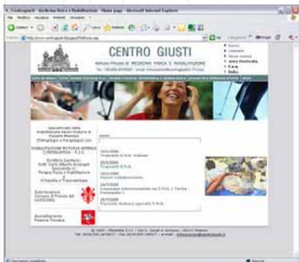
Home page di esempio

I contenuti vengono salvati in un database e visualizzati dinamicamente sulle pagine del sito.